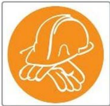
PROFESIONES Y CONSTRUCCIÓN