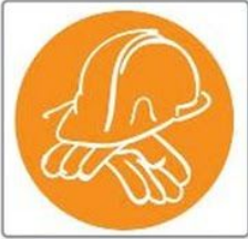
PROFESIONES Y CONSTRUCCIÓN